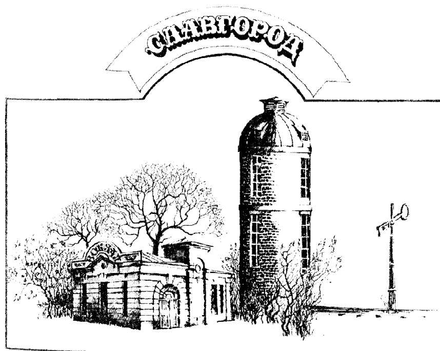
Первые здания на железной дороге. Рисунок В.Д. Гаана.

По железной дороге вывозили хлеб, мясо, сливочное масло и другие продукты сельского хозяйства.